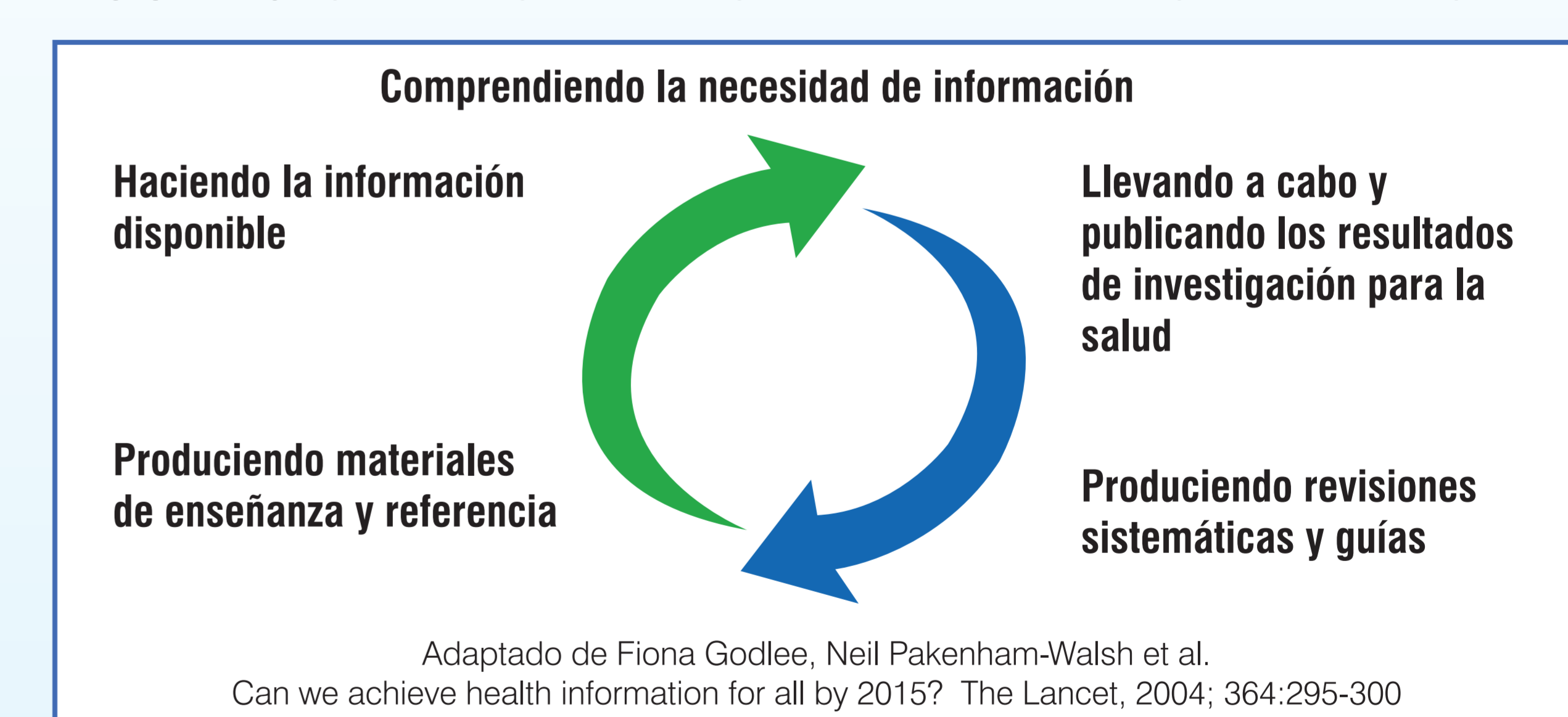
FIGURA 3. Sistema Global de Conocimiento sobre Cuidados de Salud