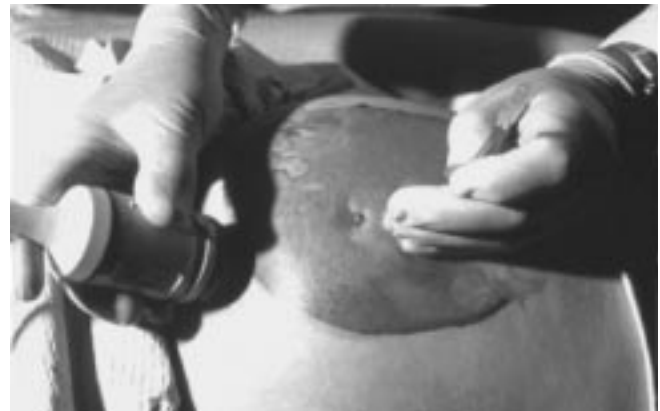
Figura No. 2. Muestra la técnica de amniocentesis guiada por USG. (Obtenido de Enciclopedia Encarta 99 Cd Rom Interactive. Microsoft.)

El pronóstico generalmente es bueno para el producto cuando el polihidramnios no tiene causa aparente (idiopático), pero se ha visto que el 17% de los casos idiopáticos tienen una anomalía cromosómica, 11 por lo tanto el cariotipo es de vital importancia para detectar estos casos. Es de hacer notar que en nuestro medio muchos de estos diagnósticos se omiten por no estar disponibles el método de cariotipo. Nuestro caso fue catalogado al final como un polihidramnios idiopático. Sin embargo, existe una duda razonable de que sea un producto completamente normal.