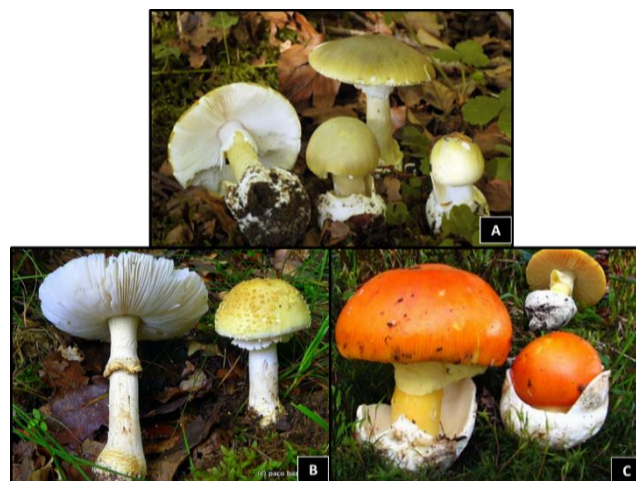
Figura 1. A. Amanita phalloides tiene un sombrero color verde, que puede volverse amarillento y después blanquecino, en la parte inferior de mismo se ven láminas blancas. El pie es blanco con manchas verdes diminutas. Su carne es blanca, tierna, inolora en ejemplares jóvenes y maloliente, agria y repugnante en especímenes viejos. B: Amanita junquillea var. amici , algunos micólogos desaconsejan su consumo por la posible confusión con A. phalloides . C: Amanita caesarea , hongo conocido como “choro” y considerada delicia culinaria en el Occidente de Honduras.

La progresión clínica de la intoxicación por setas