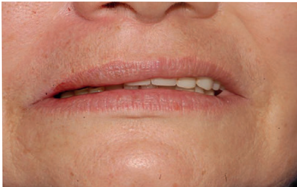
Imagen No. 1

Imagen No. 1: Vista extraoral preoperatoria del tercio inferior.