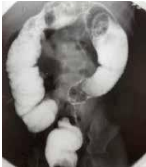
IMAGEN Nº2. RADIOGRAFÍA ABDOMINAL DE CONTROL