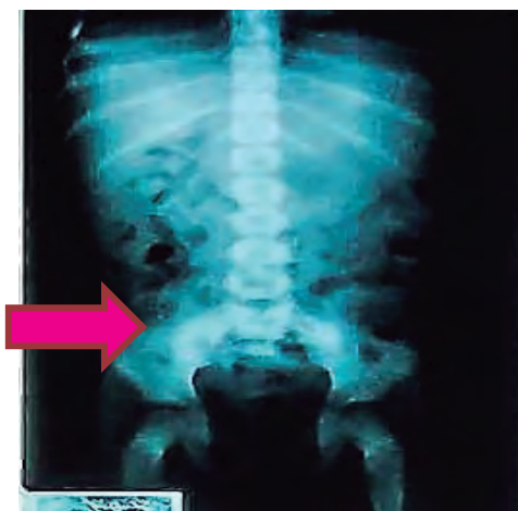
Figura B. Radiografía abdominal de después de la evacuación de piedras.

La radiografía abdominal mostró radiopacidades en forma de piedras pequeñas que se extendían desde el ciego hasta el canal anal (Figura A) en un patrón conocido como signo de mazorca de maíz. (1) Se aplicó un enema con lo que expulsó aproximadamente 30 piedras. La niña refirió haber comido piedras hacía dos días porque tenía hambre. Manejada con albendazol, sulfato ferroso, ácido fólico y multivitaminas, además se obtuvo el diagnóstico de Pica. Un bezoar es la acumulación de cuerpos extraños o nutrientes sin digerir en el tracto gastrointestinal. El litobezoar, la acumulación de piedras en el tracto digestivo, es frecuentemente vista en estómago. Un bezoar colónico primario es una situación excepcionalmente