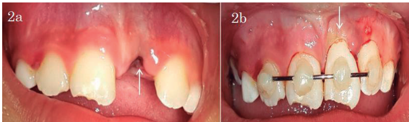
Figura No. 2. a: Diente (2.1) avulsionado. b: Ferulización con el diente en su posición.