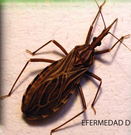
EFERMEDAD DE CHAGAS