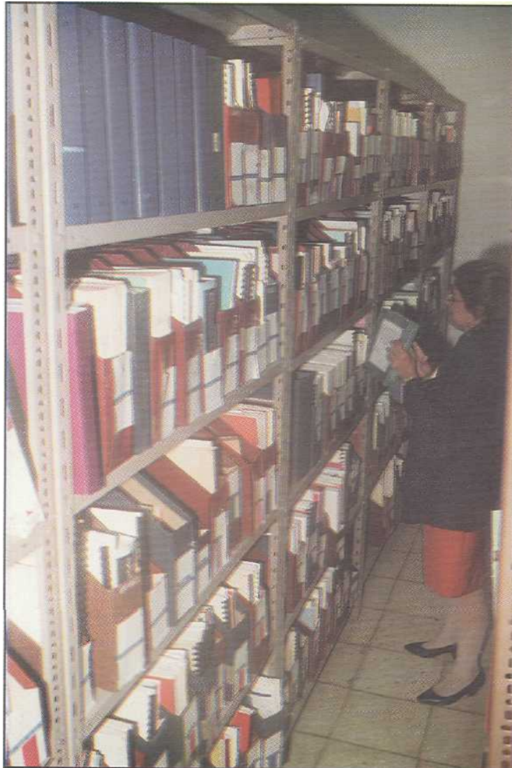
Acervos del Centro de Documentación de la OPS/OMS Honduras "Francisco Canales"

Con el sistema de la REDIDOSAH, las bibliotecarias tienen la facilidad de mantener al día y en orden los acervos de salud.