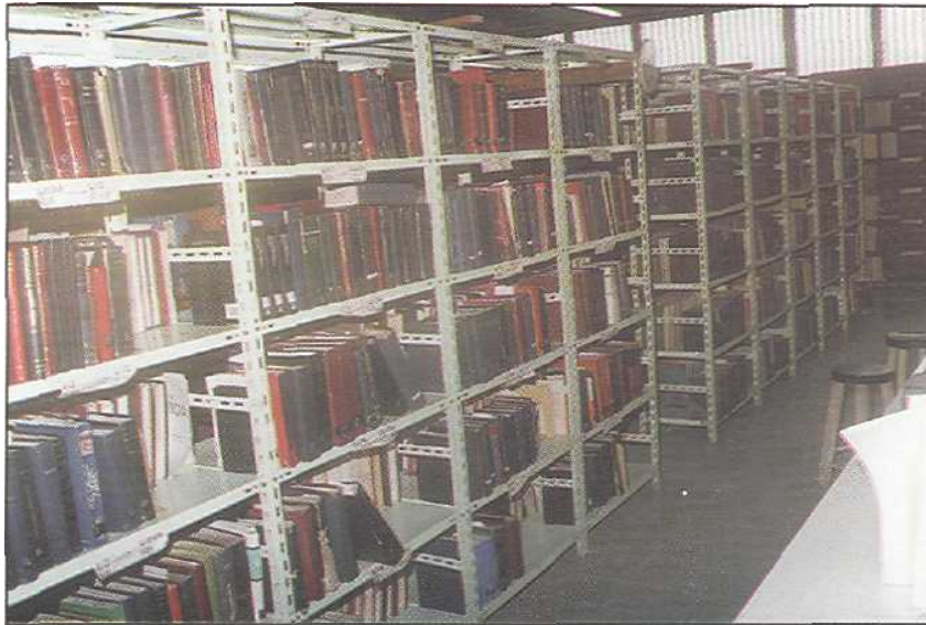
Parte de la información bibliográfica de la UNAH

Uno de los requisitos para establecer la REDIDOSAH es disponer de un área exclusiva para la Unidad de Información.