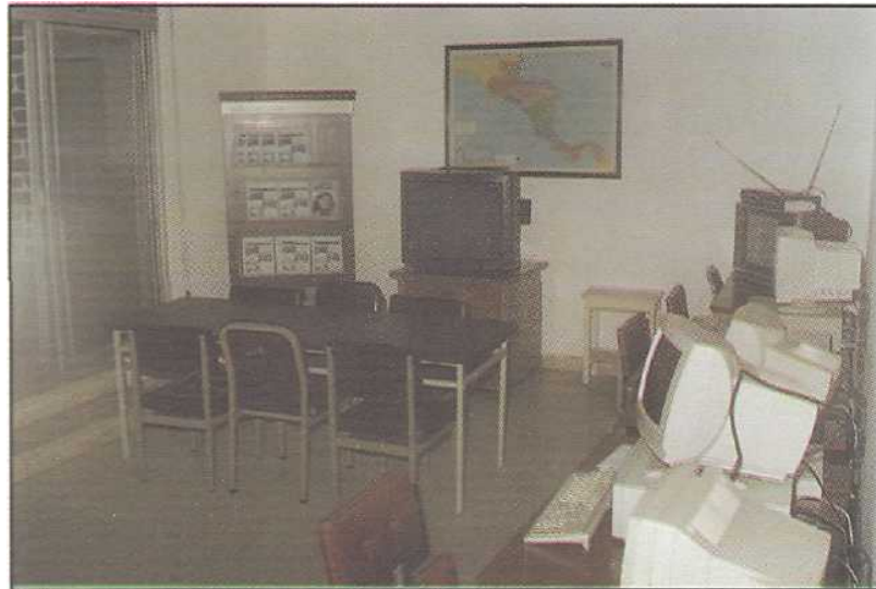
Sala de Consulta del Centro de Documentación de la OPS/OMS.

Con la REDIDOSAH, gran parte de las bibliotecas hospitalarias o centros de documentación se han equipado de computadoras para brindar información sobre actualidades bibliográficas, trabajos seleccionados sobre temas de investigación, información estadística, etc.