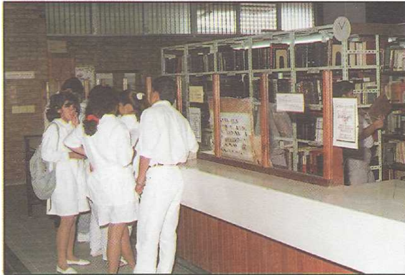
Solicitando información en la Biblioteca Médica Nacional