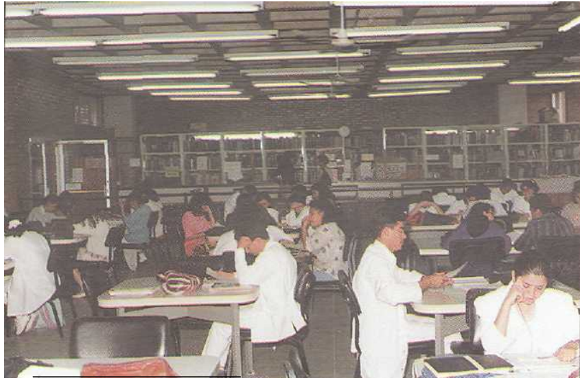
Biblioteca de la Universidad Nacional Autónoma de Honduras

Los (as) usuarios (as) tienen ahora la oportunidad de consultar todo tipo de bibliografía relacionada con la salud a través de la REDIDOSAH.