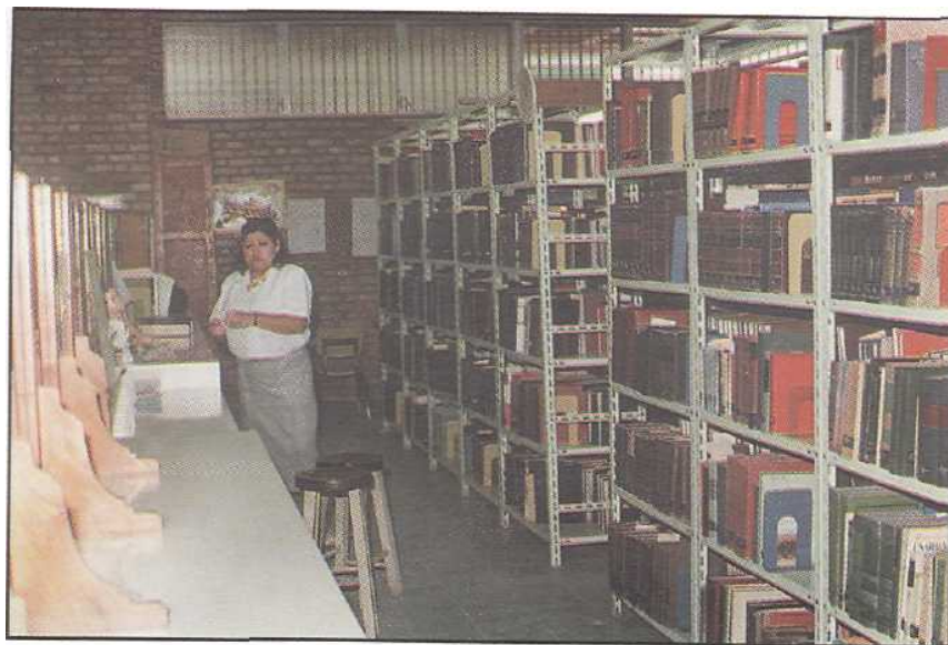
Acervos de la Biblioteca Médica Nacional

Los (as) usuarios (as) tienen ahora la oportunidad de consultar todo tipo de bibliografía relacionada con la salud a través de la REDIDOSAH.