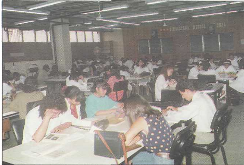
Biblioteca Médica Nacional

is part of the Library System of the Universidad Nacional Autónoma de Honduras, (National Autonomous University of Honduras) became the coordinating Center. The National Medical Library is also part of the Red Latinoamericana de Salud (BIREME) (Health's Latin American Network).