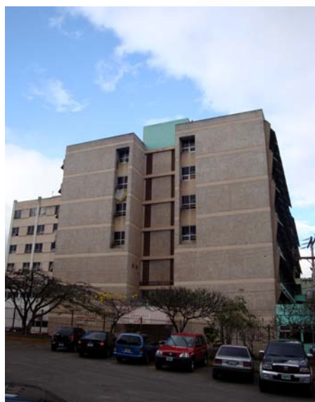
Hospital Escuela - Tegucigalpa

Es muy importante que el tema sea iniciado desde los primeros años de la carrera, asi como ir creciendo cada vez más en la Investigación Científica, de nuestros países y de toda el área, y reforzar los temas de mayor importancia en la Clínica.