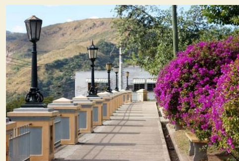
Parque "La Leona" Tegucigalpa

Sus salas estan dedicadas a la historia republicana de Honduras, haciendo la respectiva referencia a los presidentes que han gobernado en nuestro pais desde su independencia, tambien podra apreciar retratos y objetos personales de todos ellos. Uno de sus atractivos es la coleccion de autos blindados del ex presidente de la nacion el "General Carias" conocido por su mandato de mano dura.