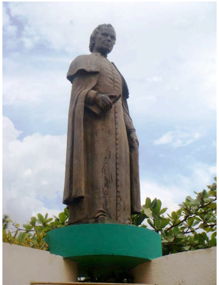
Estatua del Padre: Jose Trinidad Reyes, Fundador de la Universidad Nacional Autónoma

La Ciudad Universitaria está localizada en Tegucigalpa, Capital de Honduras, y además cuenta con ocho centros regionales distribuidos a lo ancho del país para suplir las demandas específicas de cada zona.