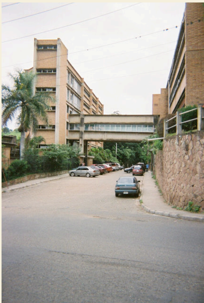
Edificio de Aulas - Facultad de Ciencias Medicas

La Facultad de Ciencias Médicas de la UNAH, fue creada como tal en el año de 1882, bajo decreto presidencial, a cargo de docentes nacionales y extranjeros de gran habilidad en el área de la salud. Actualmente, la facultad educa a 7,500 estudiantes de las carreras de medicina y enfermería.