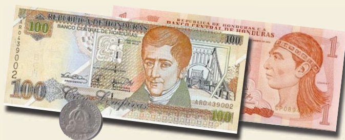
Billetes de 100 y 1 Lempiras (Moneda Nacional)