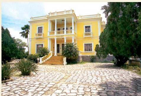
Museo Nacional "Villa Roy"

En la población existe una area con grandes galerones en donde artesanos de toda Honduras exhiben y venden sus artesanías a precios muy atractivos. Muchas de las piezas son hechas aquí mismo en Valle de Angeles. Uno de los fabricantes de finos artículos de cuero en la región, Lessandra Leather tiene su fábrica y una tienda en el pueblo, ofreciendole una variedad de finos artículos de marroquinería. Sus artículos, todos de calidad de exportación, se pueden comprar a una fracción de lo que pagaría en el extranjero. Existen solamente un hotel en Valle de Angeles, La Posada del Angel, cuenta con 25 habitaciones, todas con baño