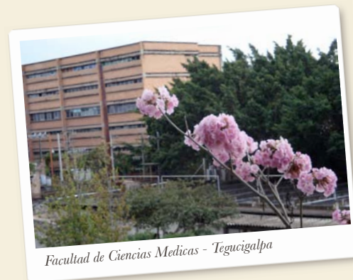
Facultad de Ciencias Medicas - Tegucigalpa