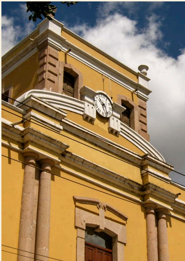
Fachada del Hospital General San Felipe - Primer Hospital Nacional

De la Asociación Científica de Estudiantes de Medicina de Honduras