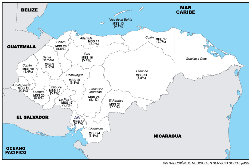
Figura 1. Distribución de número de Médicos en Servicio Social (MSS) y porcentaje (%) por Departamento, Honduras 2013-2014, n= 296.