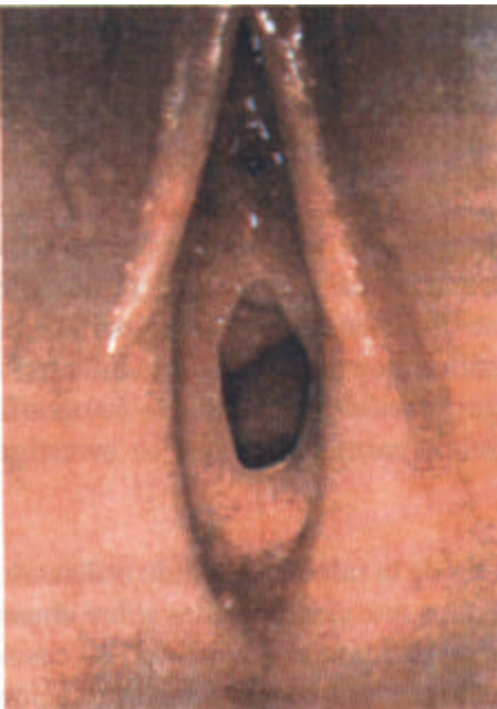
Visualización del himen y de paredes Vaginales con el colposcopio

Muran (4,5) evaluó el área genital de 205 jóvenes femeninas en etapa de pre-pubertad, quienes tenían historia en conjunto de haber sido víctimas de abuso sexual.- 130 de éstas pacientes fueron examinadas a través del colposcopio.- Sobre todo, el uso de éste instrumento fue para examinar anomalías en 32% de éstas jóvenes.- 22% de ellas tenían hallazgos no específicos y 46% tenían hallazgos fuertemente sugestivos de abusos sexual.