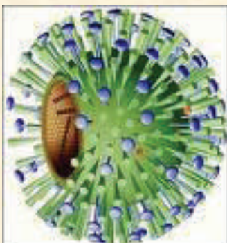
Virus A (H1N1)

Información global notificada oficialmente a la Organización Mundial de la Salud: