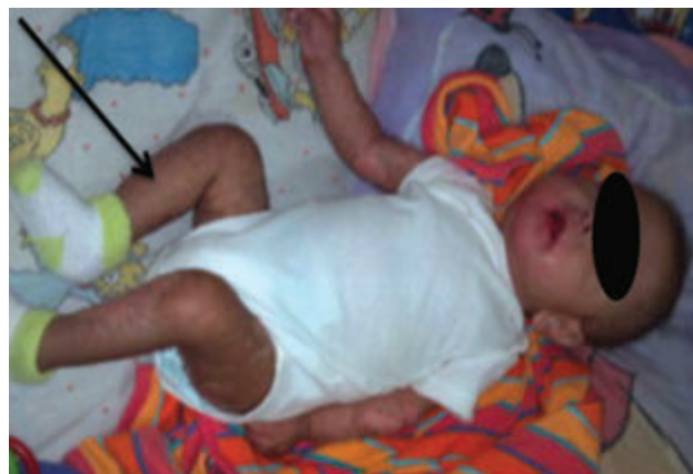
Figura No. 3: Paciente con dermatitis por deficiencia de VIL.

Nótese las áreas de descamación en las extremidades.